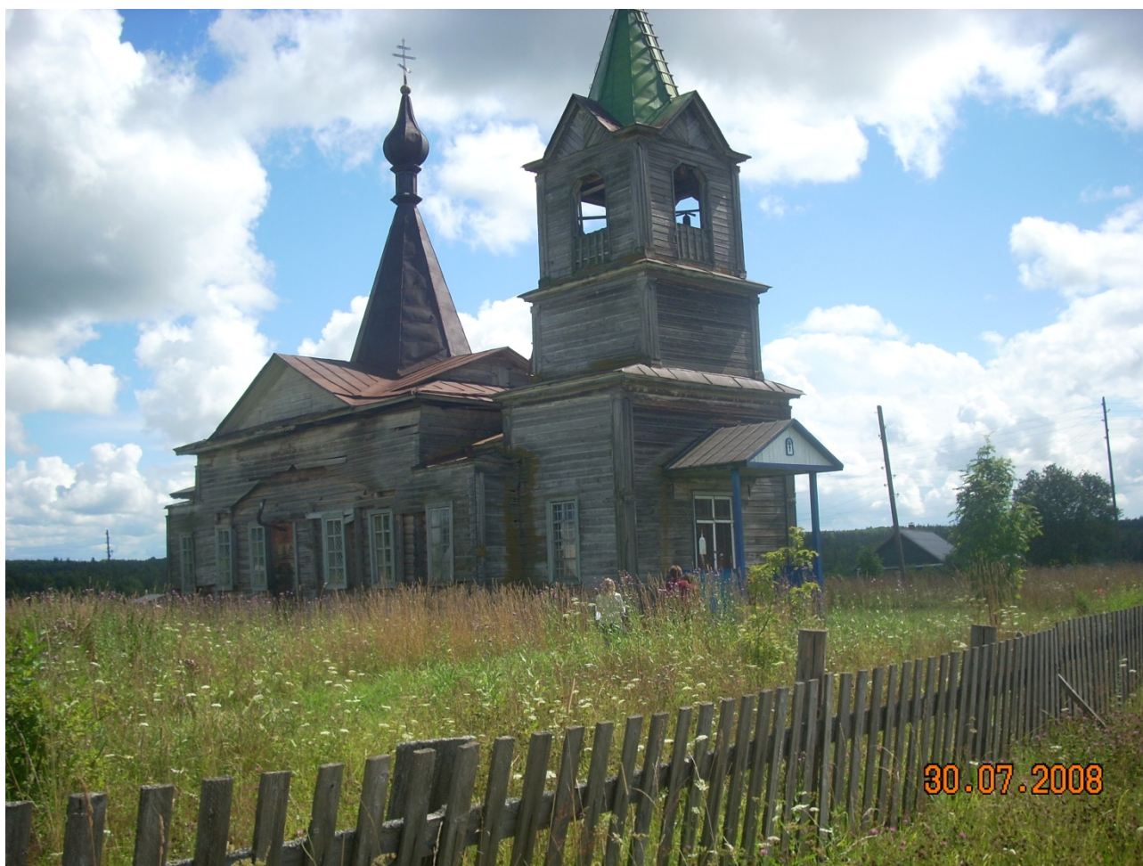
Возрождение Сретенского храма